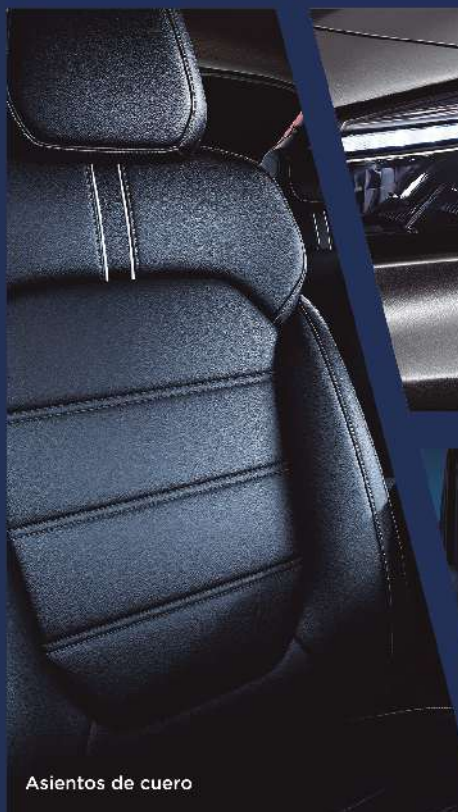
Asientos de cuero