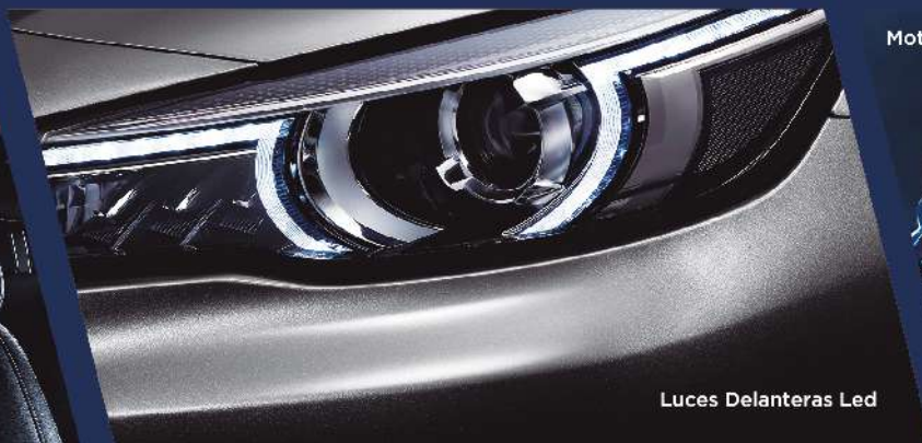
Luces Delanteras Led