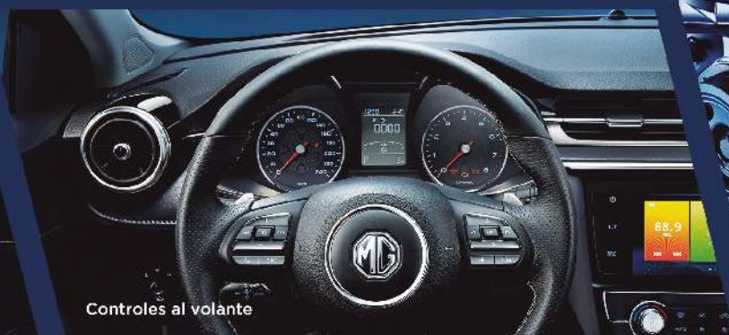
Controles al volante